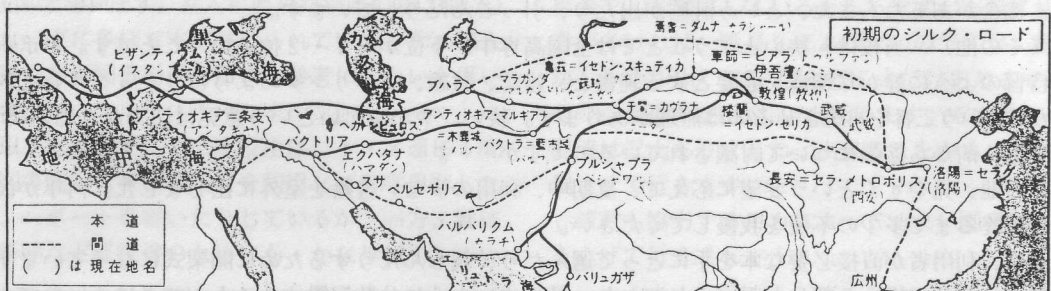
(世界大百科事典15、平凡社 から)