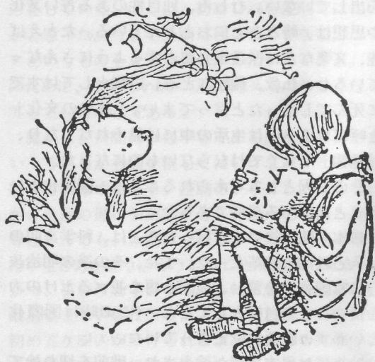
A. A. ミルン「クマのプーさん」 (岩波少年文庫) から

私がこの本を読んで思う事は、普段、何気ない笑いの中にこれほどの意味があるとは気が付きませんでした。また、何故日本の公的な場では笑ってはいけないのか、不謹慎だからだろうという以外は考えたこともありませんでした。私の身のまわりにもタテ社会はたくさんありますし、ヨコ社会もあります。これからは“協調”としての笑いを大切に、“攻撃”としての笑いに気を付け、潤いのある人間関係をつくりあげていきたいと思えます。