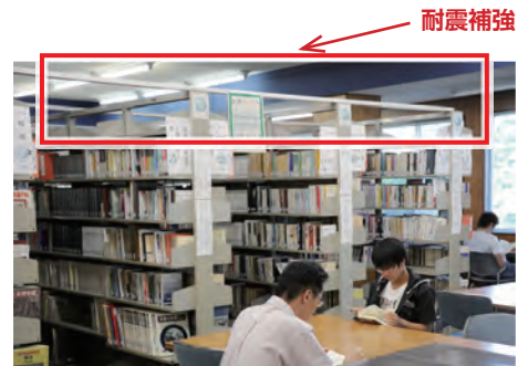
書棚と書棚を連結する耐震補強

最後になりましたが、この4年間、ご支援ご協力頂きました皆様に心よりお礼申し上げます。ありがとうございました。