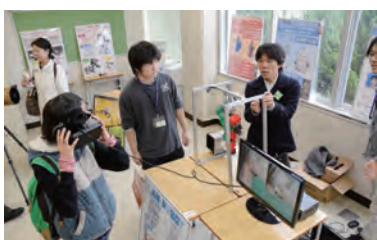
メディアコンペティションで熱心にプレゼンテーションする展示説明者