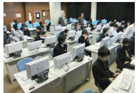
更新された教育用電子計算機の運用開始