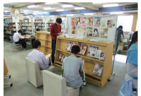
「総選挙」で女子学生の為の候補雑誌に見入る男子学生