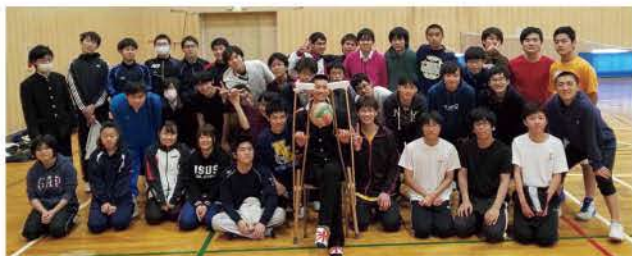
スポーツ大会での集合写真

この先、私たちはそれぞれの道を歩んでいきます。そこではこの5年間で培われた「確かな技術力」、「工夫する力」、「(主にレポート作成によって安らかに育まれた)忍耐力」が自分の、あるいは自分たちの目標へと実を結ぶことがあると思います。その時に自分の努力を認めるだけ