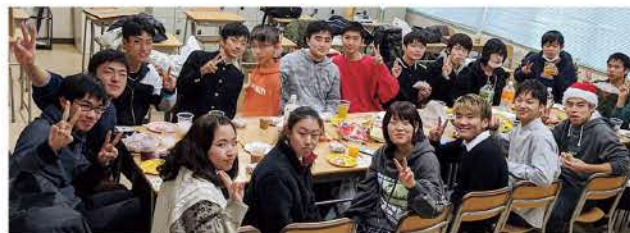
3年次のクリスマス会

最後になりましたが、私たちの高専生活を支えてくださったすべてのの方々に感謝申し上げます。本当にありがとうございました。