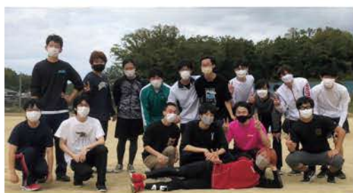
5年生 スポーツ大会