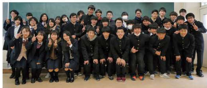
3年生最後の授業後

先生方がおっしゃるように高専生の強みは早いうちからの高度な知識、実験や研究などの経験だと思っています。これらの知識や実験技術を身につけられた事を強みにし、今後様々なところで活かしていきたいです。卒業後は、さらに専門的な知識を深めるため進学する人もいれば、企業などに就職し社会人になる人と、それぞれが自分で選んだ新たな道に進んでいきます。すべてのことが順風満帆とはいかず、いろいろな壁にぶち当たることがあると思いますが、臆することなく奈良高