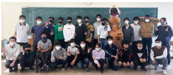
5年生スポーツ大会

卒業生の皆さん卒業おめでとうございます。5年間お疲れさまでした。5年間を振り返るとクラス全員で行ったことは球技大会と工場見学だけと少ないですが、クラスメイトの仲はとても良好で、勉強では助け合い、留年しそうな人には手を差し伸べ、休み時間には笑いが絶えないクラスでした。