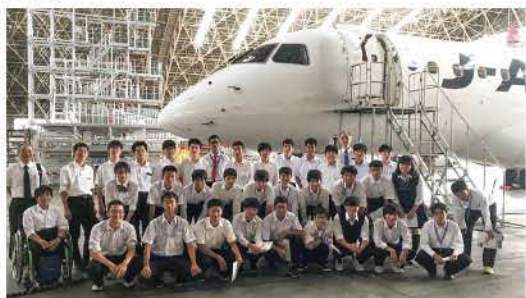
3年生秋の工場見学

今年度の5Mは、入学式から卒業式までの5年間で、多くの学生が留年してしまいました。残念なことではありませんが、1人の卒業生として自分に自信を持ってこれからの新生活に向かって行きたいと思えますし、留年した人たちも含めて皆元気でいて欲しいと願っています。