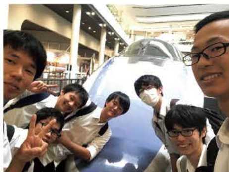
3年生社会工場見学

ため、気の合わない人がいたらどうしようかと考えていました。しかし、みんな協力的で仲の良い人ばかりだったので、何も心配せずに過ごすことが出来ました。特に、高専祭ではクラス一丸となって脱出ゲームを催し、成功したのはいい思い出です。