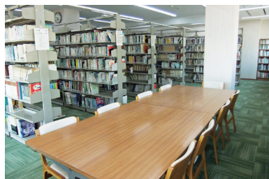
2階 閲覧室・自習コーナー Reading room and self-study corner on the 2nd floor

Library also contains 63 Japanese magazines and 3 foreign magazines.