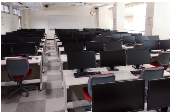
情報処理演習室2 Seminar Room 2