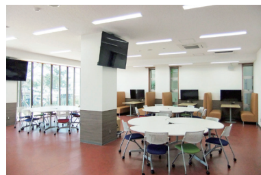
1階 ラーニングcommons Learning commons on the 1st floor