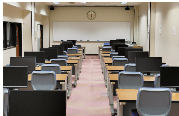
情報処理演習室1 Seminar Room 1