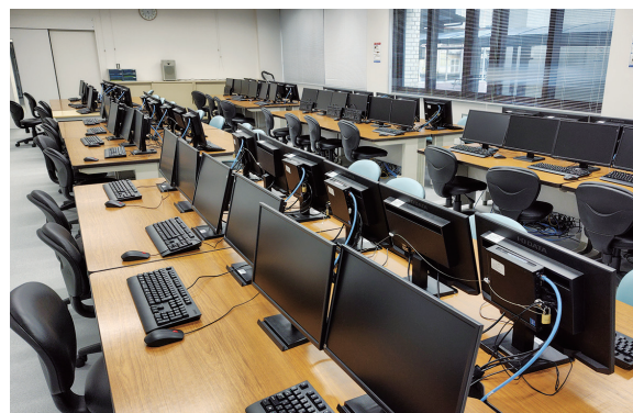
情報科学演習室 Computer Exercise Room