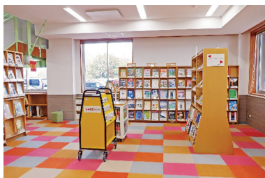
1階 閲覧室 Reading room on the 1st floor