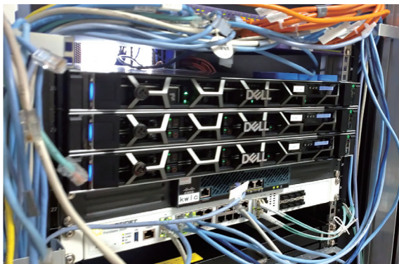
演習室用サーバ Servers for Seminar Rooms

Information Processing Seminar Rooms consist of the following; Seminar Room 1 specializing in BYOD in the general information building, Seminar Room 2 in the north building for the main building, and Computer Exercise Room in the information engineering building.