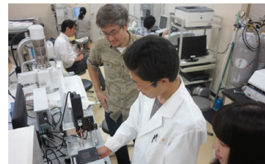
充実した研究環境での学生生活の様子 Our students live a fulfilling research life.

物質創成工学専攻では、新規プロセスの開発、設計のための化学技術教育はもちろんのこと、バイオ関連技術などの周辺技術についても教育し、幅広い視野と知識を持ち技術開発能力を備えた化学技術者の育成を目標としている。そのため、化学工学、応用化学、生物工学の各分野の科目を適正に履修させ、研究開発に必要な知識を教授するとともに、特別実験、特別研究に十分な時間を割り当て、現象解析能力、研究開発能力を育成する。特別研究では、プロセス工学、生物工学、有機合成化学、電子応用化学などの研究分野において時代の動向に応じた先端的な研究を行う。専攻科学生は、これらの中から境界領域を含めて、幅広く研究テーマを選択することができる。