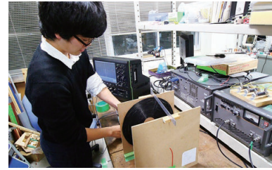
非接触給電に関する特別研究 Research projects related to wireless power transfer

For the coexistence of the environment and development in the real world, the students who belong to the electrical and electronic system course are required to enhance their problem-solving ability through the practical curriculum with wider vision. To make a significant contribution toward a new industry standard, the curriculum contains not only the classes pertaining to leading-edge electrical and electronic technology but also the cross-disciplinary course works like Engineering Design Project and Research Project. In fact, the teachers instruct a wide range of academic fields from internet of things (IoT) technology for Industry 4.0 known as the fourth industrial revolution to large-scale smart grid system for environmental conservation. Moreover, since the students actively address their research themes from a variety of angles throughout two years, the teachers can cultivate the human resources with the ability and the energy. We strongly hope that our students bring diversity to the community and create positive change in the industrial society.