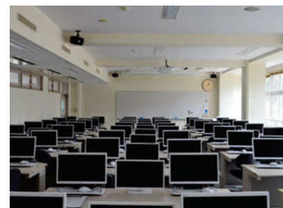
マルチメディア演習室 Multimedia Room