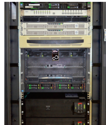
サーバ室 Computer Server Room