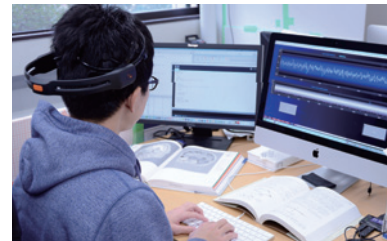
プログラム理解時の脳活動計測に関する研究 Brain Activity Measurement during Program Comprehension in Pre-Research Projects

The course offers advanced academic programs in information system fields providing the engineering education equivalent to university; enhancing the research capability on the application and development in the field of the information system. The curriculum is designed to meet a variety of career development or particular interest for students requirements related to information systems; including the specified mathematical and theoretical subjects, and professional engineering subjects such as advanced theory of computation, computer hardware, software design and media system. It is allowed for students to select subject from information engineering depending on their interest to join industry directly as a skilled engineer or to continue studies in a graduate school. Each student is required to take the several independent workshops for improving their technological and professional skills, and also, to complete the independent research project or the thesis work for enhancing their research ability and activity.