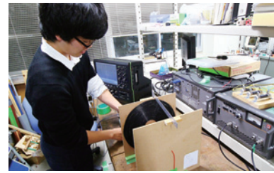
非接触給電に関する特別研究 Research projects related to wireless power transfer

For the coexistence of the environment and development in the real world, the students who belong to the electrical and electronic system course are required to enhance their problem-solving ability through the practical curriculum with wider vision. To make a significant contribution toward a new industry standard, the curriculum contains not only the classes pertaining to leading-edge electrical and electronic technology but also the cross-disciplinary course works like Engineering Design Project and Research Project. In fact, the teachers instruct a wide range of academic fields from internet of things (IoT) technology for Industry 4.0 known as the fourth industrial revolution to large-scale smart grid system for environmental conservation. Moreover, since the students actively address their research themes from a variety of angles throughout two years, the teachers can cultivate the human resources with the ability and the energy. We strongly hope that our students bring diversity to the community and create positive change in the industrial society.