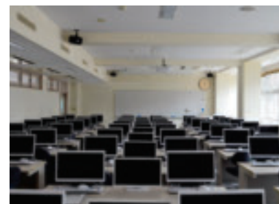
マルチメディア演習室 Multimedia Room