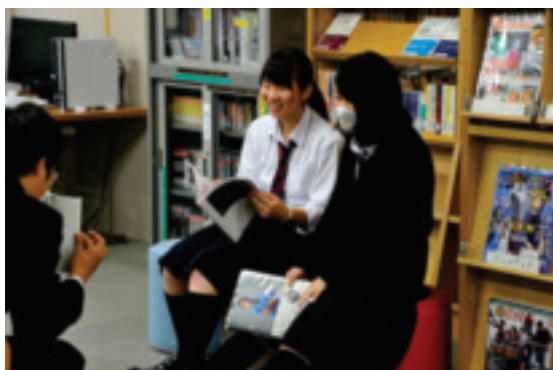
2階 情報検索・雑誌コーナー Information Research and Magazine Corner

Library also contains 71 Japanese magazines and 4 foreign magazines.