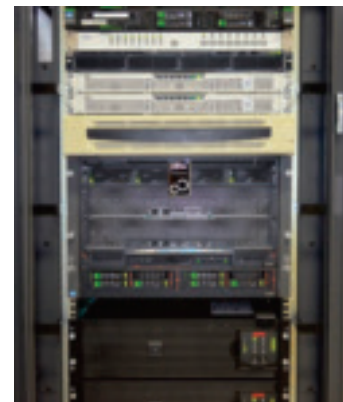
サーバ室 Computer Server Room