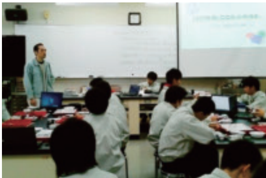
教育支援活動 Educational support activity