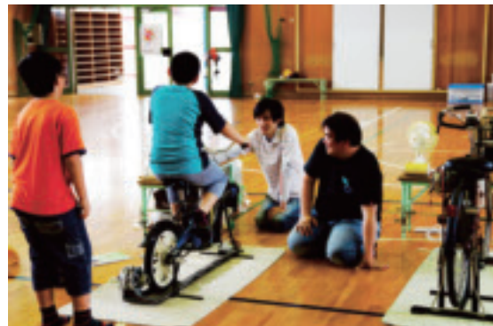
地域貢献活動 Regional contribution activity