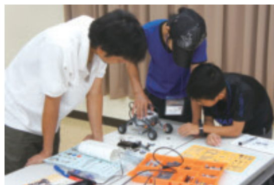
地域貢献活動 Regional contribution activity