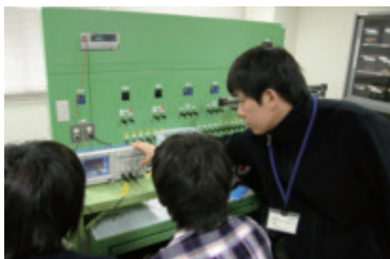
教育支援活動 Educational support activity