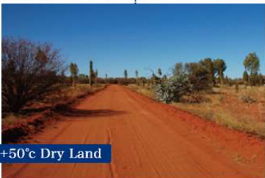
+50°C Dry Land