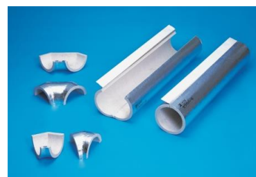
排気ダクト用防火材