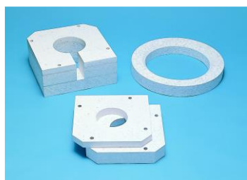
溶融アルミ用断熱