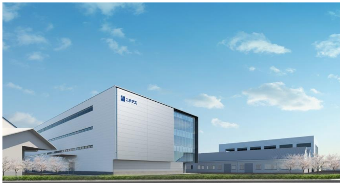
新1号棟完成予想図(2017年10月)