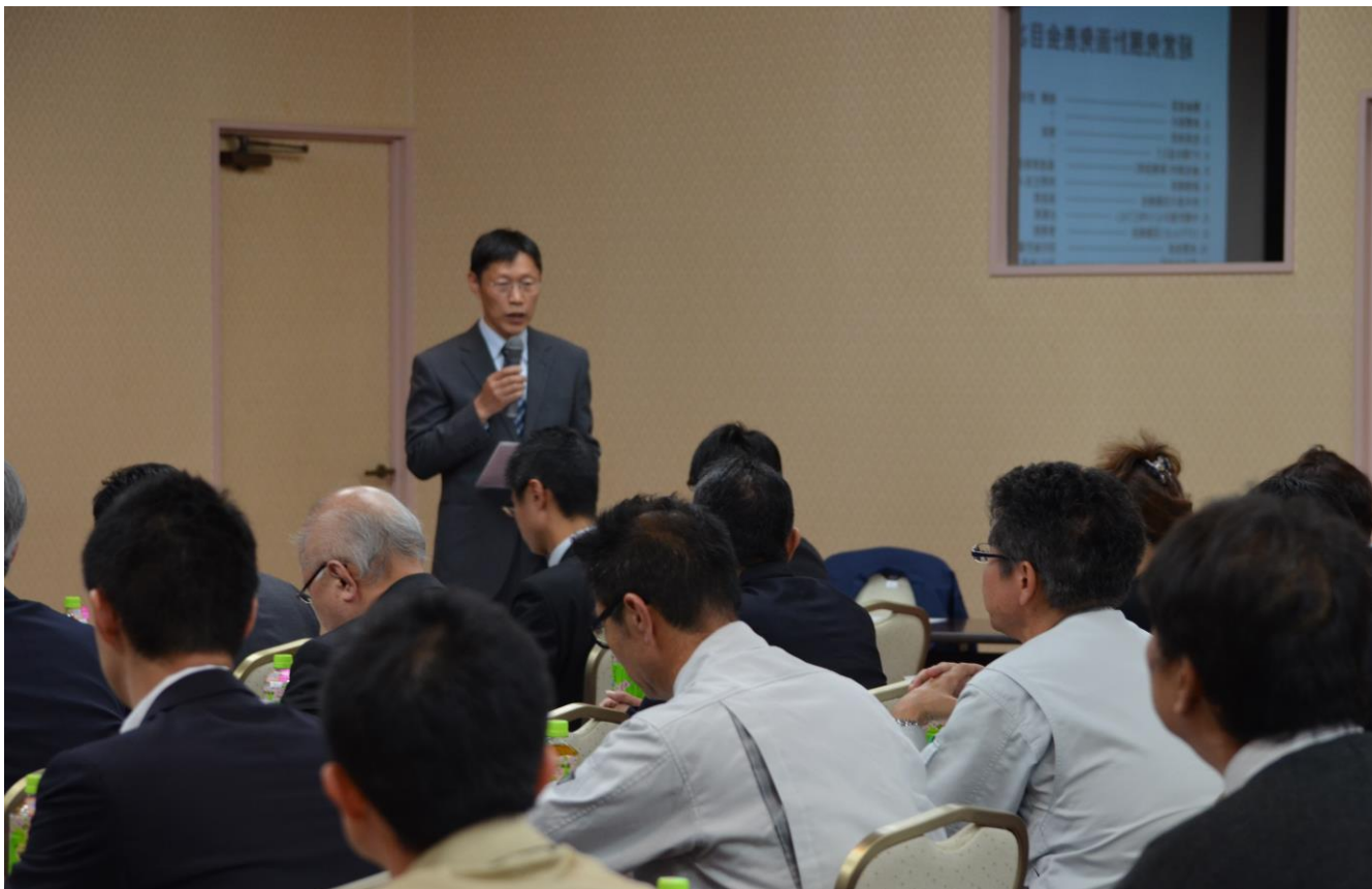
【第57期経営発展計画発表会】の写真 毎年1回 銀行、取引先、異業種交流会の各社社長を前に報告する東田社長