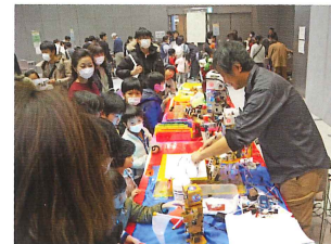
科学のまちの子どもたち事業 (けいはんな科学体験フェスティバル)