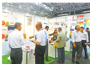
企業展への出展支援 (メッセナゴヤへの出展の様子)

けいはんな学研都市に立地する中小・ベンチャー企業のニーズに応じた支援を行うとともに、展示・商談会を通じて企業進出を促進します。