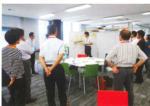
けいはんなR&D イノベーションコンソーシアム

けいはんな学研都市の先端技術の蓄積を活用し、競争的資金や国際戦略総合特区制度も利用しながら、新産業の創出・集積を進めます。