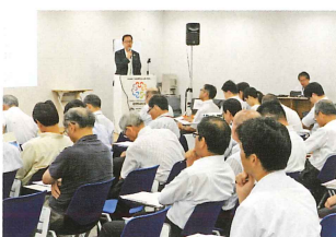
けいはんな先端シーズフォーラム

けいはんな学研都市の立地施設が持つ有望な技術を、関西の大手企業をはじめとする新産業創出会員に紹介し、相互連携の場を提供します。