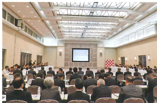
新たな都市創造会議(総会)

けいはんな学研都市の都市づくり、都市の運営に関する調査研究・企画立案を行い、関係者間の合意形成を進めます。