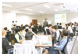
けいはんな リサーチコンプレックス