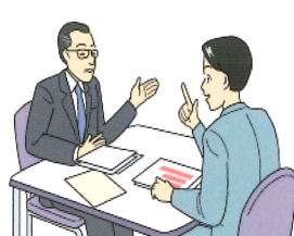
コーディネーターなどによる マッチング活動