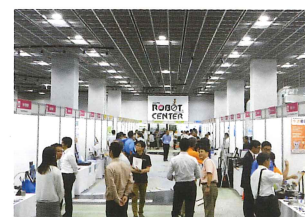
けいはんなビジネスメッセ ビジネスマッチング展