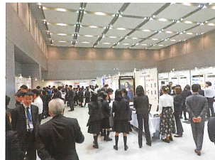
けいはんな情報通信フェア

けいはんな学研都市で暮らす研究者、住民も参加できる様々な産学官連携の交流プロジェクトを推進するとともに、企業立地を支えます。