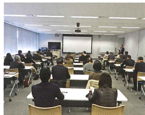
けいはんな広報ネットワーク講演会