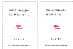
学研都市建設推進要書