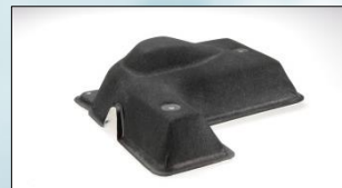
自動車用防音カバー

工場からの騒音や自動車のエンジンやブ レーキからの音・振動を低減することで、 快適な生活の実現に寄与しています。