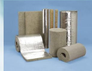
ロックウール断熱材

加熱、冷却されたものの温度を保ったり、 外部からの熱を断つことで、省エネルギー に貢献しています。