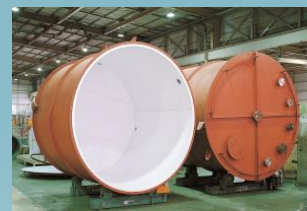
ふっ素樹脂製タンクライニング