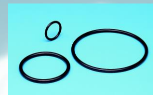
半導体製造装置用ゴムOリング

半導体製造などわずかな不純物も許さ ない工程で使用されるクリーンを保った 製品・部品を提供しています。