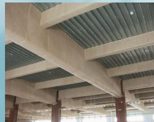
巻付け耐火被覆材

工業炉や焼却炉、または火災で建物が 火にさらされても耐えるための材料を提 供しています。