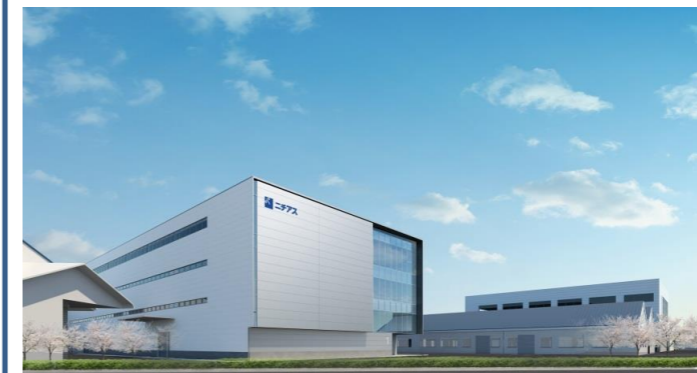
新1号棟完成予想図(2017年10月)