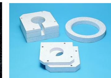
溶融アルミ用断熱材