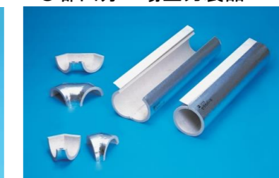
排気ダクト用防火材