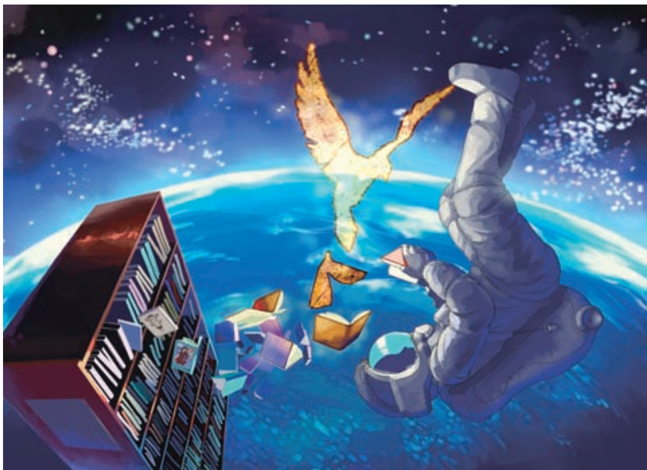
絵：4I 中川 雄貴