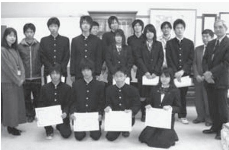
読書感想文入選者と多読表彰クラス代表の皆さん（校長室にて）